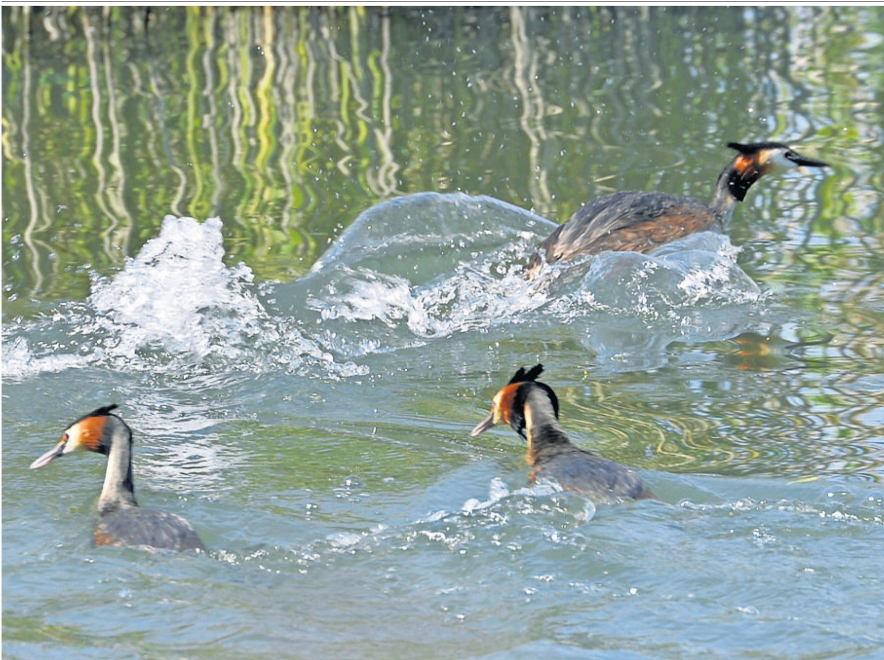
Des grèbes huppés s'ébattent dans la réserve des Grangettes. Depuis 1989, la fondation qui gère ce petit paradis du bout du Léman y a étendu les marais et les roselières. Elle a aussi fait revenir des oiseaux nicheurs. PATRICK MARTIN Lire en page 26